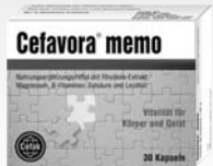
Rhodiola + Aktivnährstoffe